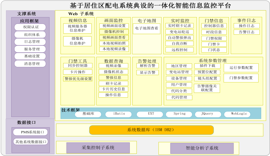
图 2 系统的应用部署设计